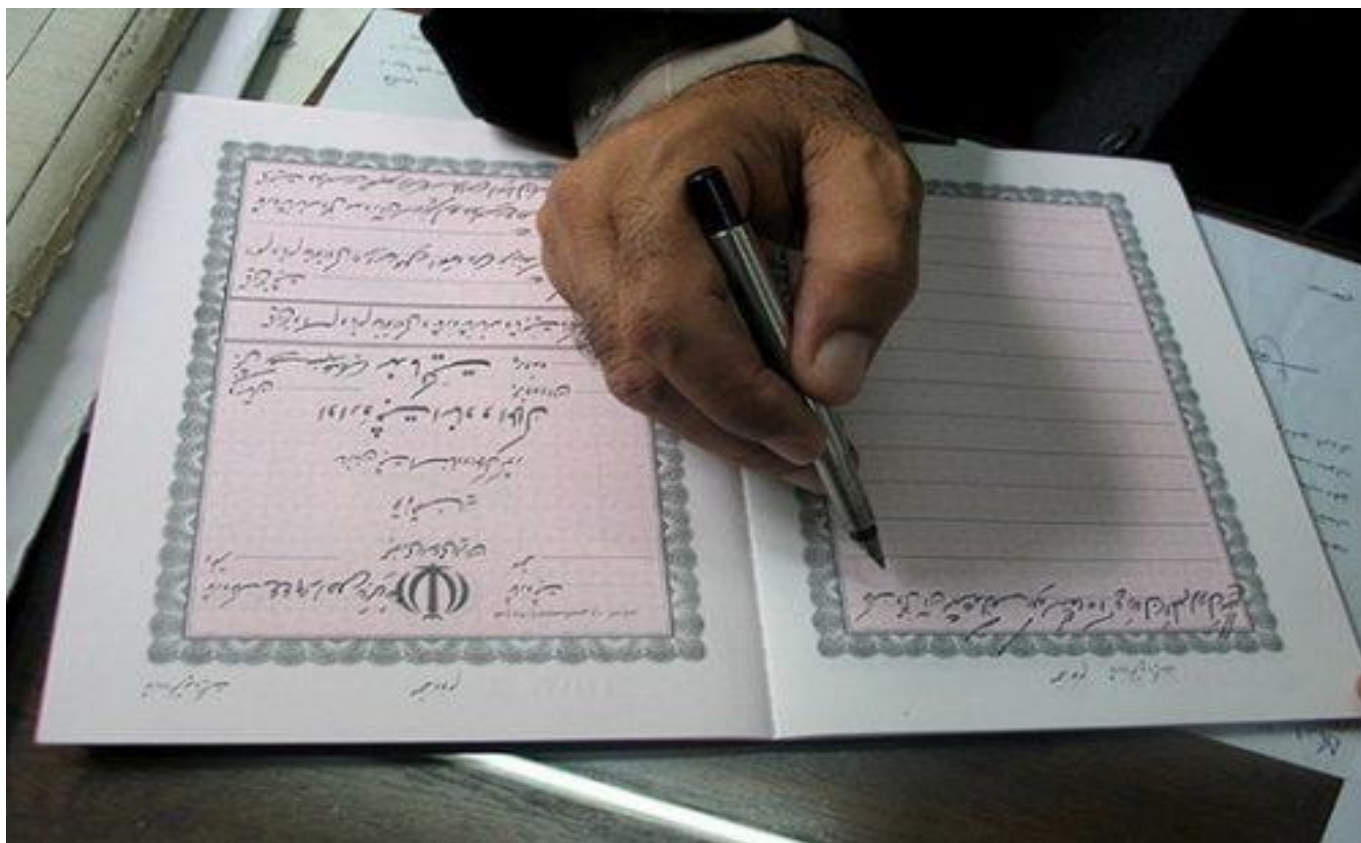
تنظیم سند رسمی