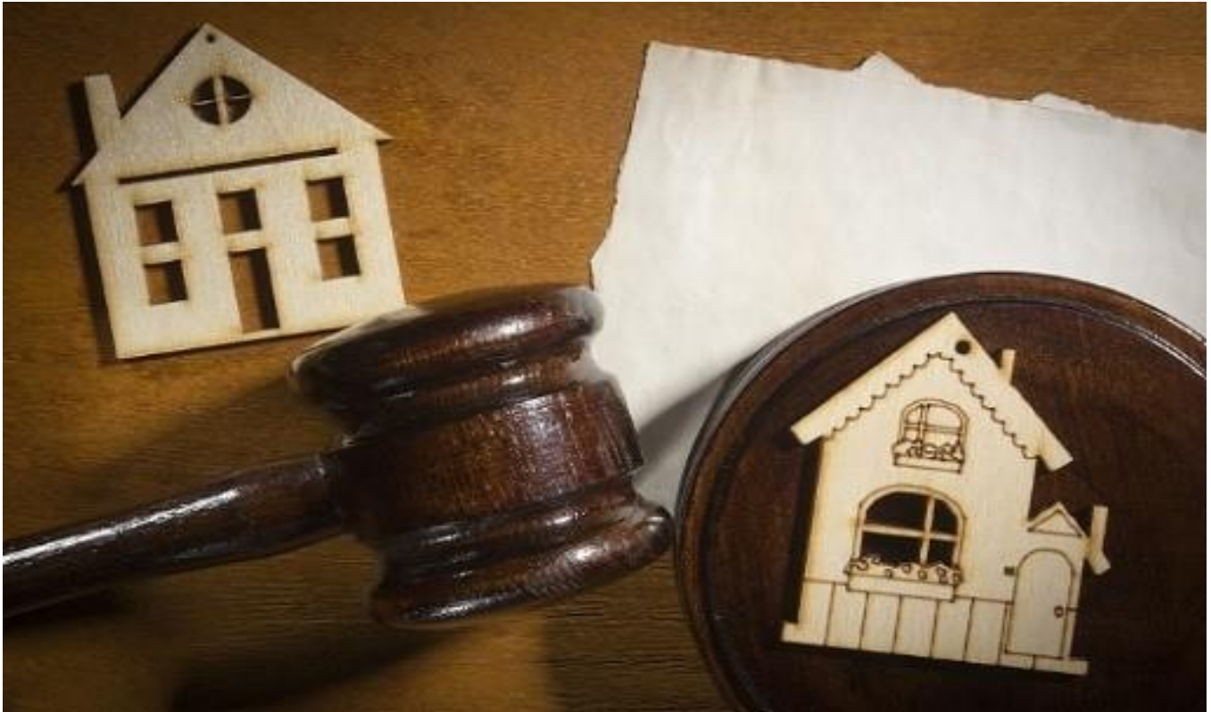
مشاوره حقوقی تنظیم سند رسمی

پیش ببرید تا در آینده دچار مشکل نشوید. از دیگر مزیت های داشتن وکیل پایه یک دادگستری در این زمینه این است که کار های شما در کمترین زمان ممکن انجام می شود و در بسیاری از مراحل دیگر نیازی به حضور شما در دادگاه نمی باشد.