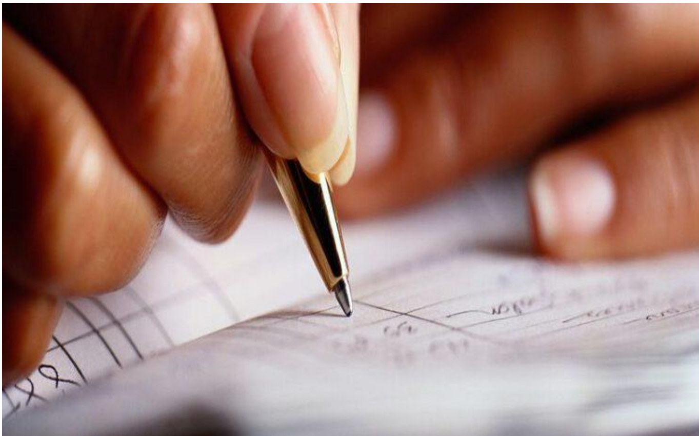
مشاوره حقوقی ملکی رایگان

مشاوره حقوقی ملک رایگان به صورت تلفنی و آنلاین در شرق تهران و تهرانپارس و نارمک توسط وکیل متخصص و حرفه ای در زمینه املاک و اراضی توسط گروه حقوقی وکیل ۲۴ انجام می گیرد. اگر فکر می کنید که در زمینه ی تنظیم سند رسمی نیاز به راهنمایی دارید می توانید از وکلایی که در این گروه حقوقی حضور دارند راهنمایی دریافت کنید. مشاوره اختصاصی در زمینه املاک و اراضی به شما کمک می کند تا در کار های خود بهترین تصمیمات را رقم بزنید.